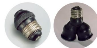
改良アタッチメントプラグと 二灯用クラスター